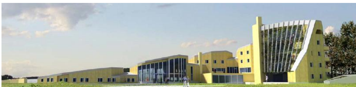
Figur 2. Förslaget efter samrådet.

Mot bakgrund av de redovisade bristerna vad gäller samrådsprocessen, där anläggningens tänkta storlek fördolts vid det första samrådet och därefter inte vederbörligen kommunicerats med remissinstanserna, och dessutom misstanke finns om att samrådet inte haft någon egentlig betydelse, är det Naturskyddsföreningens bestämda uppfattning att antingen samrådets första skede måste göras om, med rätta fakta, främst vad gäller anläggningens storlek, eller att anläggningens omfattning anpassas till den som förespeglades i det första skedet.